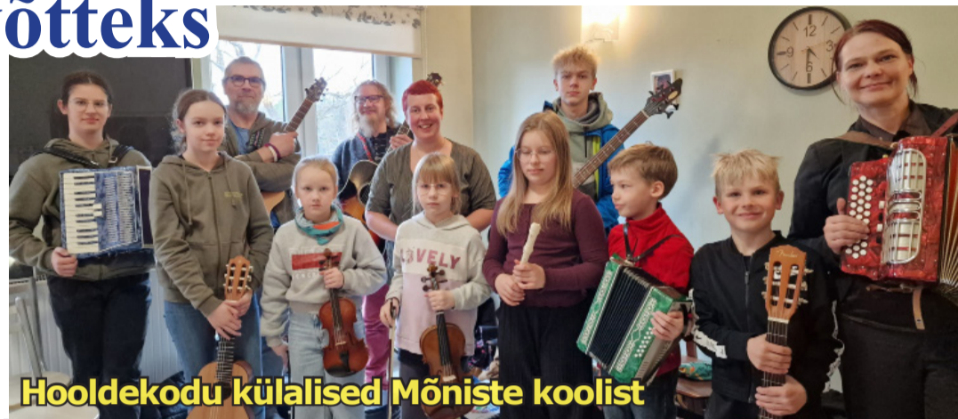
Hooldekodu külalised Mõniste koolist

Kevad saabub rõõmsamate nootidega. Mõnistes toimus sel aastal Rõuge valla koolide ühis-kontsert. Meelde jäävad meeleolukas muusikapasa kevadkontsert ja koolisisene peotantsuvõistlus. Asja saime ka teate, et meie koolile on omistatud taas Rohelise Kooli sertifikaat. Selle saamiseks tuleb koolis teha rida tegevusi, mis loodushoidlikku elustiili järgivad. Osalesime Aasta Kooli konkursil. Finaali seekord ei pääsenud, aga kuna õpilased arvasid, et tasub kindlasti konkursil kandideerida, siis tuleb seda uuel aastal taas teha.